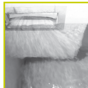
◀ Buffering van het ontijzerde water