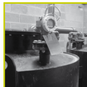
▲ Toevoeging van natriumhypochloriet

Na de ontijzering wordt natriumhypochloriet ( NaOCl ) 6 toegevoegd aan het gefilterde water, om het te desinfecteren en om bacteriegroei in het leidingnet te verhinderen.