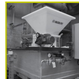
▶ Het polymeer dat wordt toegevoegd in de decanter wordt in drie stappen aangemaakt met behulp van polymeerpoeder en water

Het gedecanteerde water wordt naar het begin van het station gevoerd 12 om opnieuw het ontijzeringproces te doorlopen en wordt dus niet geloosd maar volledig hergebruikt.