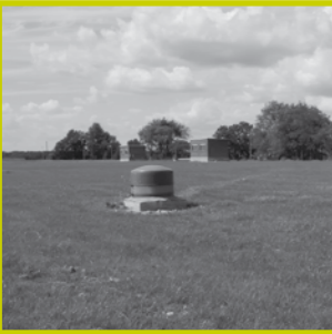
▲ Het reservoir heeft een inhoud van maar liefst 50.000 m 3

Het gefilterde water wordt van de buffertank in het station naar het reservoir naast het gebouw gebracht. Dit heeft een inhoud van in totaal maar liefst 50.000 m 3 , wat overeenkomt met de inhoud van 20 Olympische zwembaden. Dit reservoir is belangrijk voor het opvangen van pieken in het gebruik van de drinkwaterklanten. Zij hebben immers niet op elk moment evenveel water nodig: het gebruik ligt overdag veel hoger dan 's nachts, met pieken van 7 tot 9 en van 16 tot 21 uur. Het is niet mogelijk de productie volledig af te stemmen op deze pieken, maar een reservoir laat toe om toch op elk moment voldoende water ter beschikking te stellen. Het reservoir maakt het ook mogelijk om steeds een reserve aan drinkwater ter beschikking te hebben bij korte onderbrekingen in de productie of aanvoer.