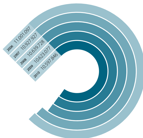
Verkocht water (m 3 )