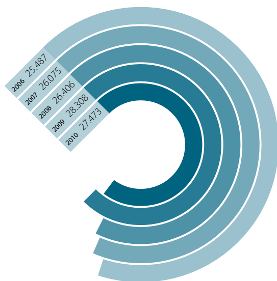
Omzet/km net (€) 2